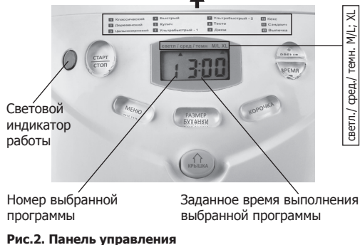
Рис.2. Панель управления